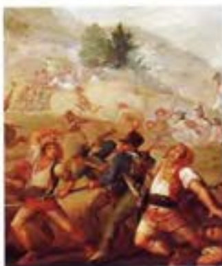
Escena de la guerra del Francès, J.B. Flaugier, s.d.

de catalanes —com la societat ibèrica o la romana— acabaren conformant el substrat sobre el qual es forjaren els Països Catalans.