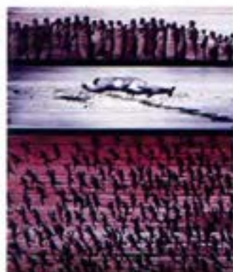
Plaça de Sant Agustí Vell, F. Català-Roca, Barcelona, s.d., ACR.