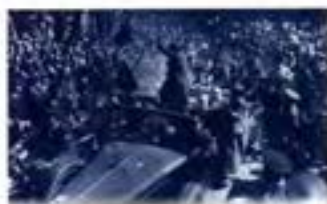
Soldats republicans cap a un camp de concentració, R. Capa, Rosselló, febrer del 1939