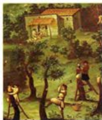
Treball al camp, J. Nadal, s.d., col·l. part.

general que comença analitzant les primeres manifestacions de la presència de l'home en l'actual territori dels Països Catalans i finalitza en la més viva actualitat, en la societat de les acaballes del segle XX, la dels anys noranta. Es comença, per tant, analitzant les primeres societats que es desenvoluparen històricament en aquest àmbit territorial, aquelles que, si bé és abusiu qualificar-les ja