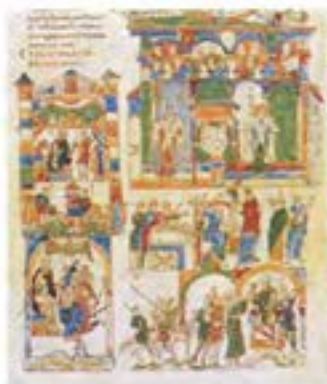
Fragment del retaule de la Trinitat, 1489. MHR.