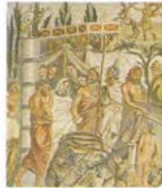
Sacrifici d'Igualada. Empúries, segle I aC.

Pretenem, per tant, oferir un millor coneixement del que fou el conjunt de la societat dels Països Catalans i, això, fer-ho per diferents camins, a través d'anàlisis variades i complementàries la unió de les quals ens doni una panoràmica prou rica i exacta de la realitat històrica. A tota l'obra hi ha, doncs, el predomini d'una voluntat interdisciplinària, de tractament de les diferents èpoques des de prismes diferents, cosa que no és corrent en la majoria de les obres d'història.